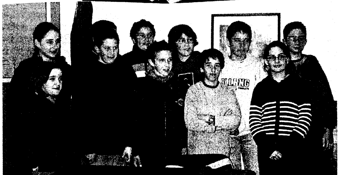
Notre premier conseil municipal de jeunes