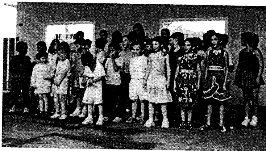
Un spectacle pour clôturer le mois de juillet à Artigueloutan .

La municipalité tient à remercier l'association qui a laissé une grande partie de son matériel à la disposition de l'école : ordinateurs, jeux, réfrigérateur, mobilier .