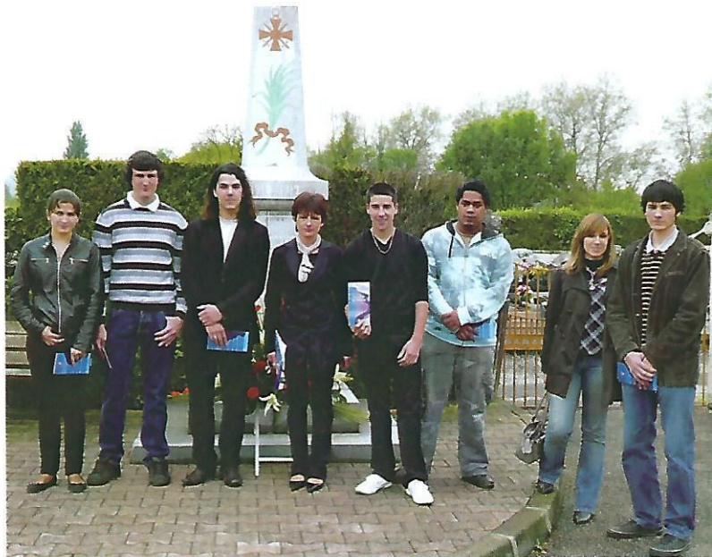
Cérémonie du 8 mai 2009 suivi de la remise du "livret citoyen" aux jeunes de 18 ans.