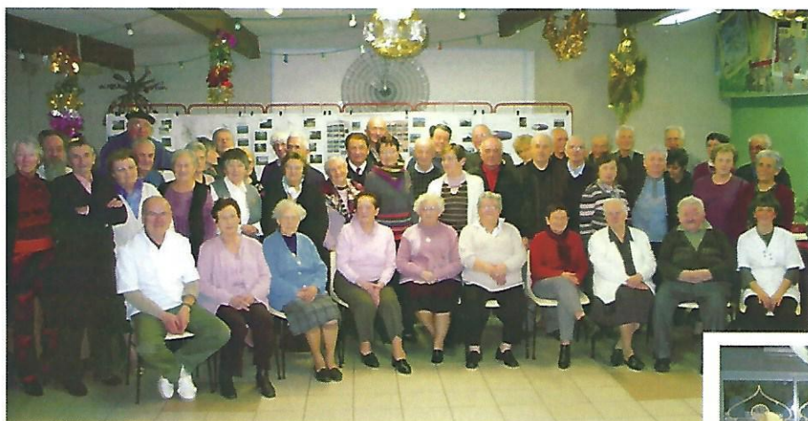
Le repas des Aînés de la commune le 25 janvier : un moment de distraction apprécié par tous.