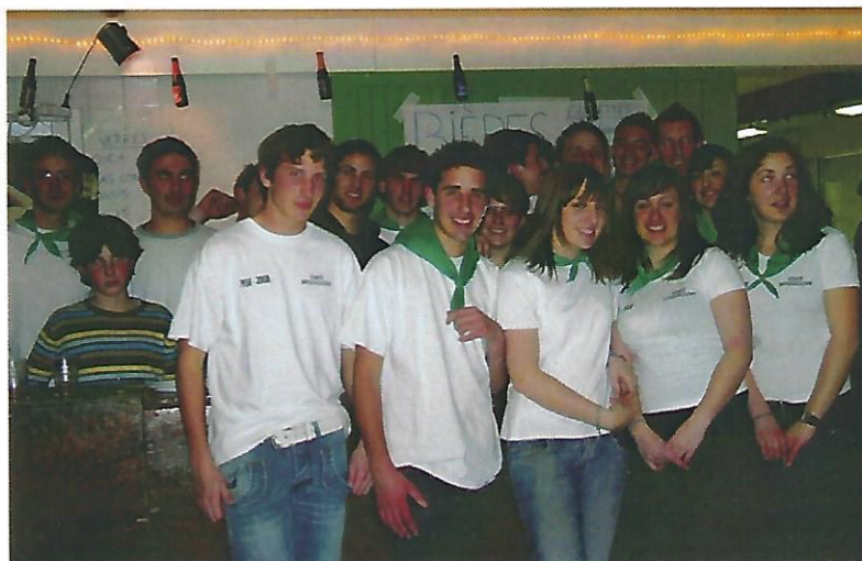
Le comité des fêtes lors du repas Choucroute-bières du 28 février.