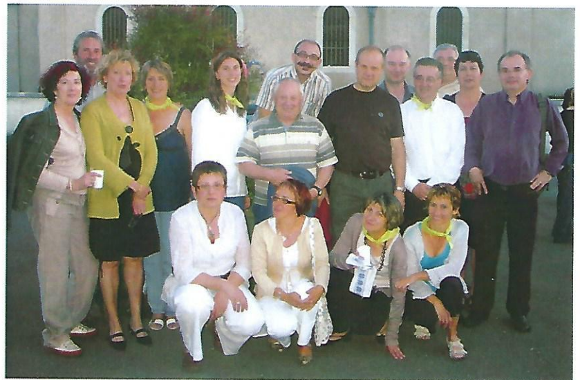
...suivi d'un repas dans la bonne humeur habituelle.