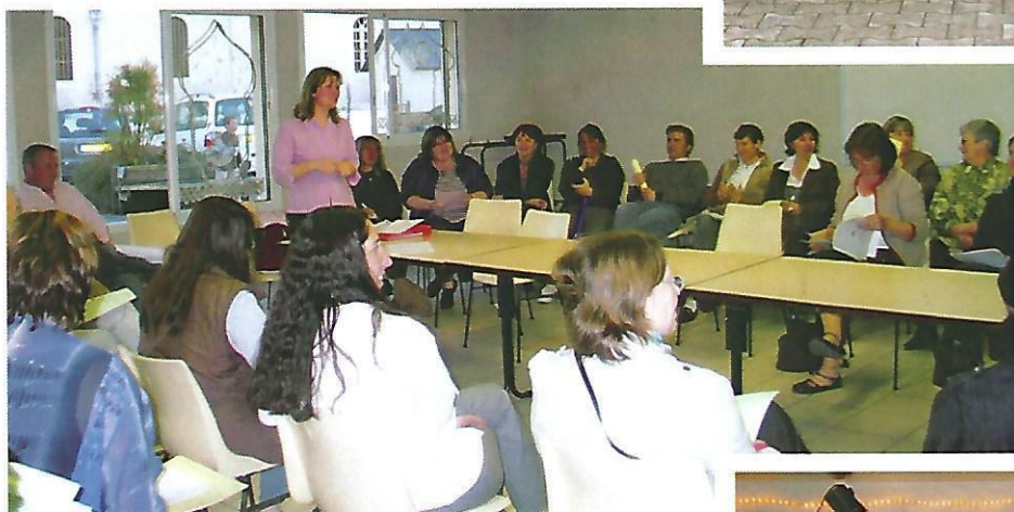
1er anniversaire de la création de l'AMAP d'Artigueloutan : une belle réussite, un rendez-vous hebdomadaire autour de produits de qualité ; de nouveaux contrats sont régulièrement proposés grâce à l'engagement des bénévoles de l'association.