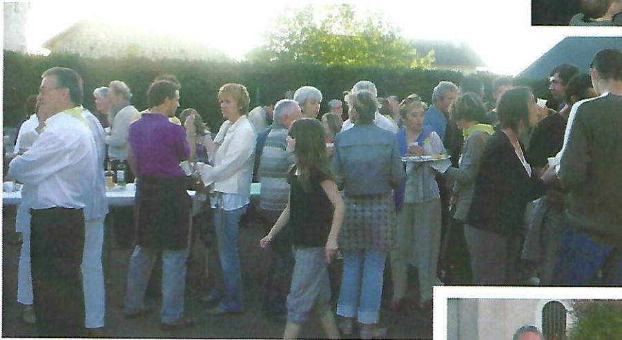
1989-2009 : les vingt ans du foyer rural ont été dignement fêtés, le 16 mai : du matin jusqu'au soir, les responsables ont présenté leurs activités et accueilli les visiteurs...