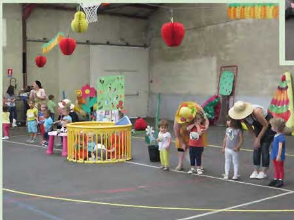
Le 9 juin, le spectacle de fin d'année des Tchoupinous