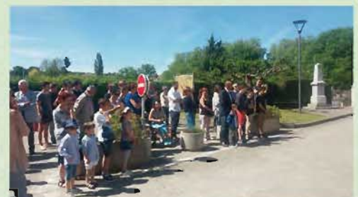
Cérémonie du 8 mai 1945 en présence de nombreux enfants et habitants de la commune