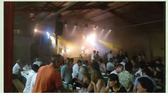
Soirée dansante avec l'orchestre MIAMI et 450 repas servis