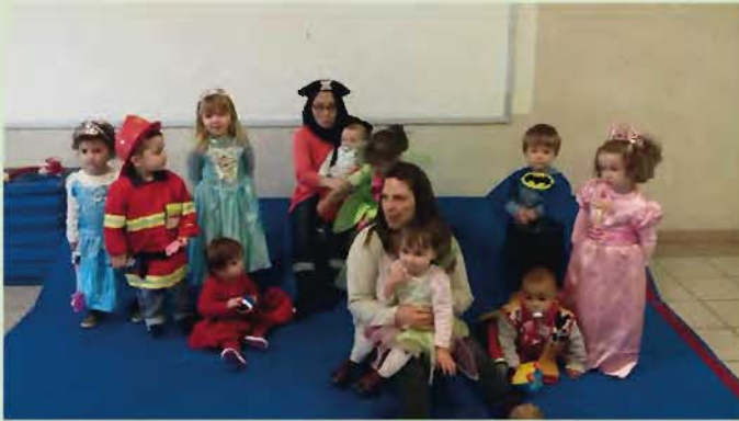
Il n'y a pas d'âge pour se costumer, les Tchoupinous ont fait également leur Carnaval