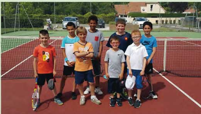
Le 14 mai, les enfants qui ont participé au petit tournoi interne organisé par le Tennis club d'Artigueloutan, tout le monde a passé une bonne journée