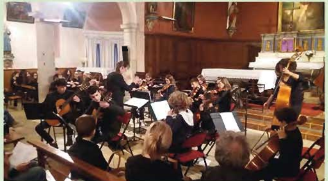
Vendredi 17 mars, "Orchestre à cordes" à l'église Saint-Jean-Baptiste d'Artigueloutan, par le Conservatoire à rayonnement départemental PAU BÉARN PYRÉNÉES