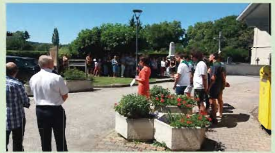
Dimanche 25 juin, traditionnel dépôt de la gerbe au monument aux morts par les jeunes du Comité des fêtes et en présence de nombreux élus et habitants