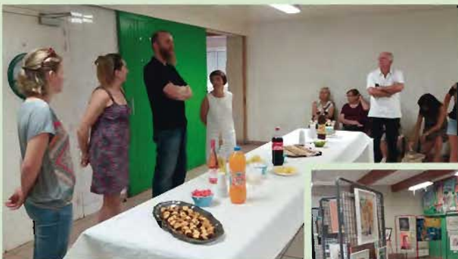
Le 27 mai, ART'igueloutan s'expose, un beau vernissage de la section dessin du Foyer rural