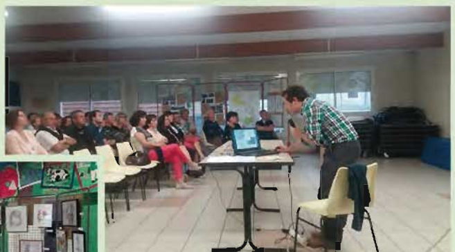
17 mai, réunion publique de présentation et restitution de l'étude Centre bourg