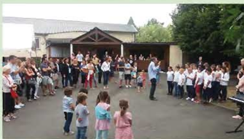
Une belle soirée d'été pour cette fête de la musique 2017, avec la chorale de l'école, Artiguelout'en chœur et nos musiciens locaux, un grand merci à tous les participants