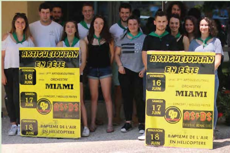
Le Comité des fêtes d'Artigueloutan, pose la photo officielle 2017, félicitations à toute l'équipe ...