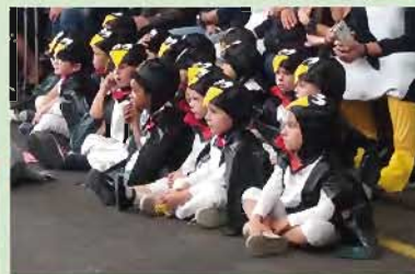
Dimanche 2 juillet, Fête de l'école, des tableaux originaux minutieusement préparés et un public nombreux pour les admirer