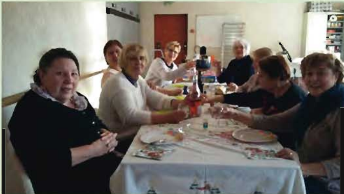
Atelier "Cuisine" du Foyer rural, une bonne occasion de se retrouver dans la bonne humeur autour d'une table bien garnie