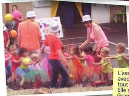
L'association "Les Tchoupinous", avec les nounous organise diverses activités tout au long de l'année pour les tout petits. Elle se réunit le mardi et jeudi matin à la salle Grande Ourse. Le 5 juillet a eu lieu un beau spectacle avec les enfants pour le plus grand plaisir des parents.