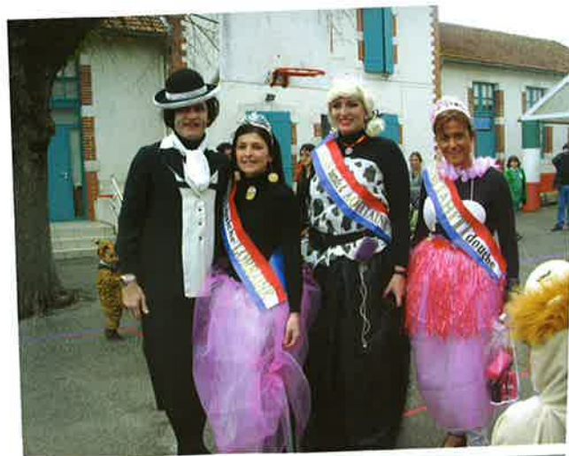
Les "Miss d'Artigeloutan", prêtes à conquérir Paris pour les élections nationales...