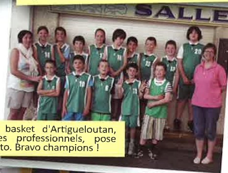
L'école de basket d'Artigueloutan, comme des professionnels, pose pour la photo. Bravo champions !