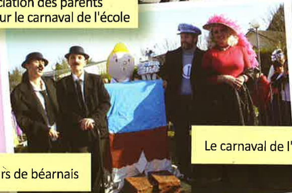
Le carnaval de l'école