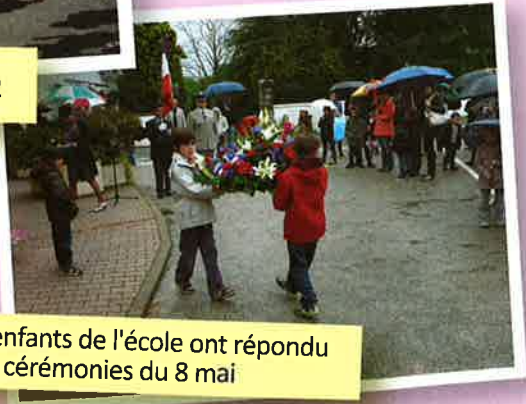
Malgré la pluie, les enfants de l'école ont répondu présent aux cérémonies du 8 mai