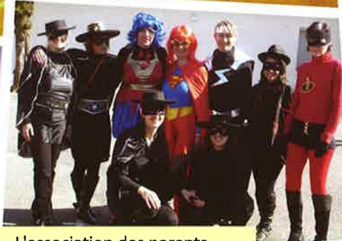
L'association des parents d'élèves pour le carnaval de l'école