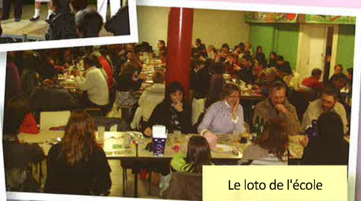
Le loto de l'école