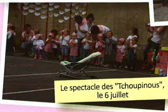
Le spectacle des "Tchoupinous", le 6 juillet