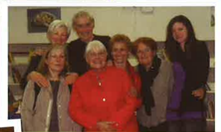
le repas des aînés 2012 : grâce aux acteurs du club soleil couchant, nous avons partagé un excellent moment de rires et de détente après le toujours fameux repas servi par la Table de Montserrat.