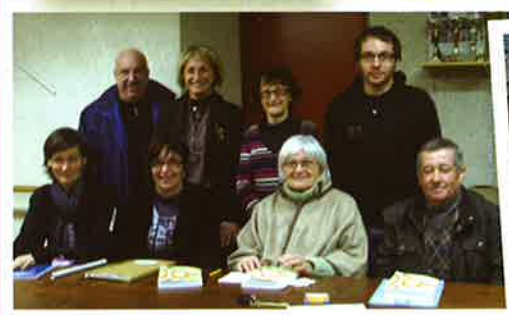
Les cours de béarnais