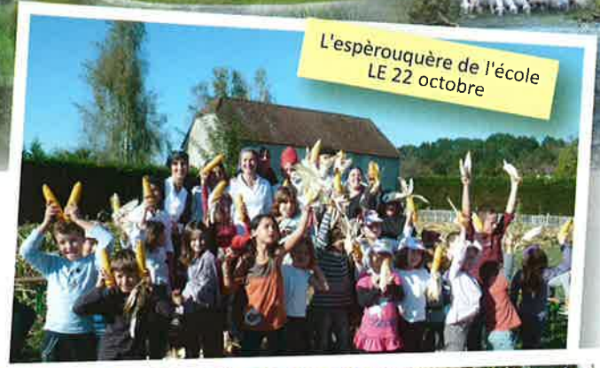
L'espèrouquère de l'école LE 22 octobre