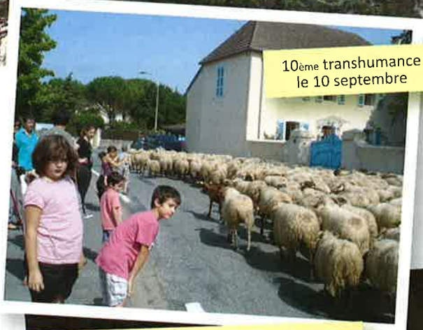
10 ème transhumance le 10 septembre