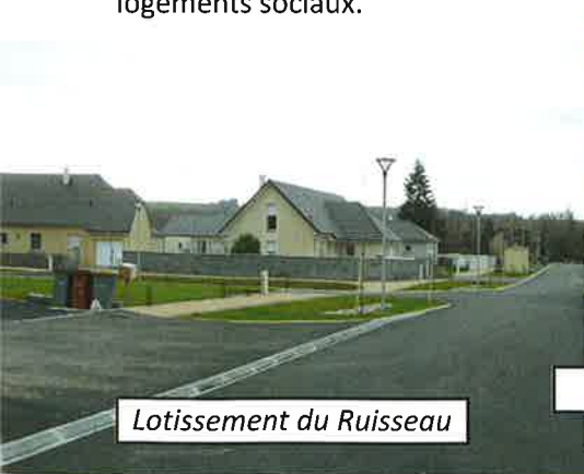
Lotissement du Ruisseau

- Globalement les constructions se répartissent harmonieusement dans toute la commune avec cependant un point fort, Rue du Ruisseau, avec la construction d'un lotissement de 13 logements. Il n'est pas aisé de maîtriser l'urbanisation mais grâce à un travail de fond, grâce aux moyens de la communauté d'Agglomération, puis de l'EPFL, nous avons pu différer quelques projets afin de maintenir une évolution supportable. De plus, nous avons eu la volonté de permettre à des familles plus modestes de se loger à Artigueloutan grâce à la construction de 6 logements sociaux.