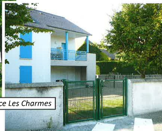
Résidence Les Charmes