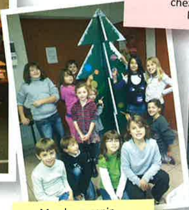
Mon beau sapin ... décoré par les enfants