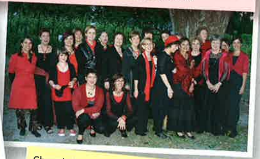
Chorale "Cœur de femmes" le 26 novembre au profit du Téléthon