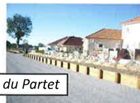
Le chemin du Partet