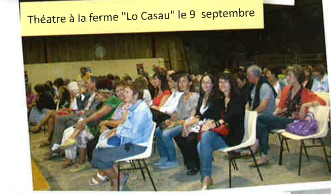
Théâtre à la ferme "Lo Casau" le 9 septembre