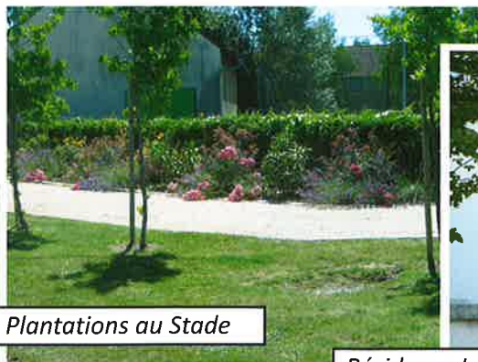
Plantations au Stade