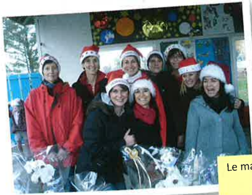
Le marché de Noël des parents d'élèves à l'école d'Artigueloutan même le Père Noël était là...