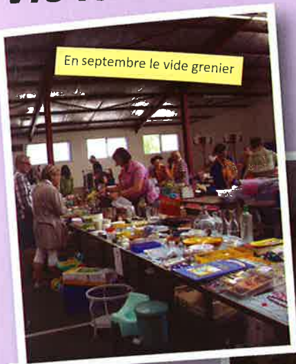
En septembre le vide grenier