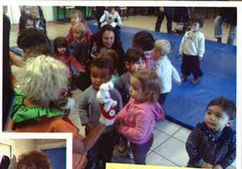
Le Noël des tous petits Tchoupinous le vendredi 13 décembre