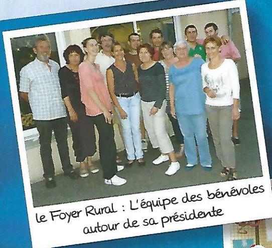
Le Foyer Rural : L'équipe des bénévoles autour de sa présidente