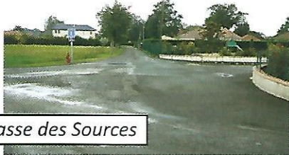
Impasse des Sources

- Giratoire route de Nousty : cet aménagement pris en charge par le Conseil Général doit être réalisé cet automne. Situé au niveau de l'impasse des Sources, ce giratoire de dimension modeste est destiné à ralentir la circulation sur la route de Nousty où deux accidents liés à une vitesse excessive ont été constatés.