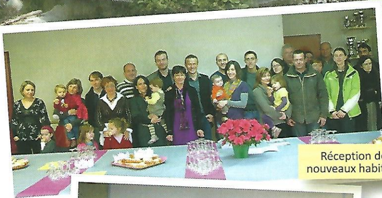
Réception des nouveaux habitants