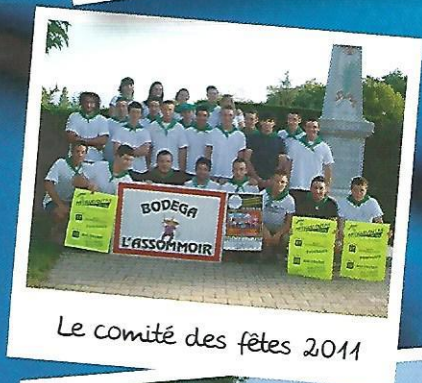
Le comité des fêtes 2011