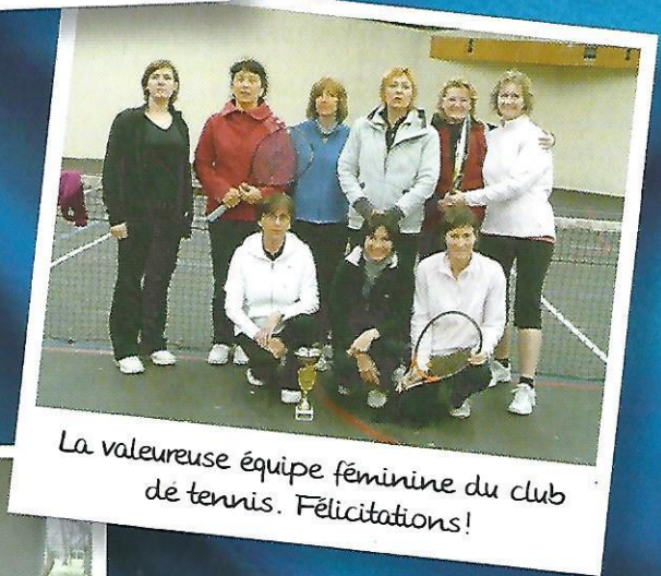
La valeureuse équipe féminine du club de tennis. Félicitations!