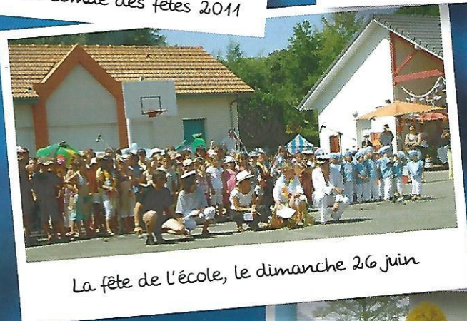
La fête de l'école, le dimanche 26 juin