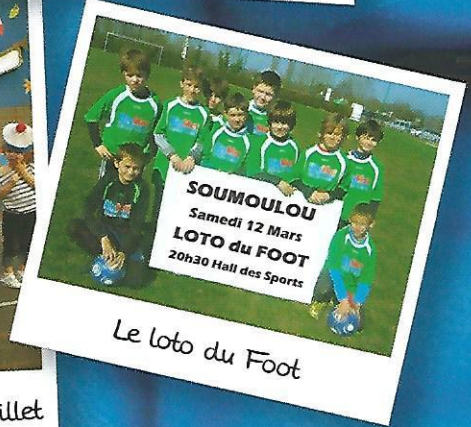
Le loto du Foot