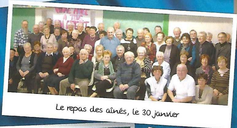
Le repas des aînés, le 30 janvier