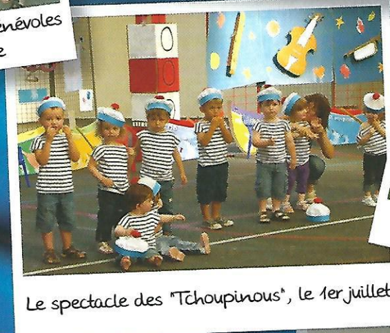
Le spectacle des "Tchoupinous", le 1er juillet