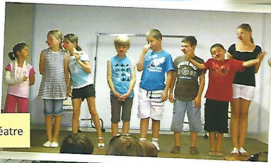
Le clown théâtre