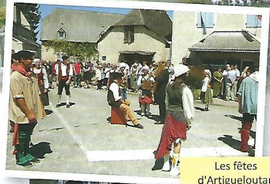
Les fêtes d'Artigueloutan