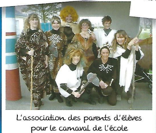
L'association des parents d'élèves pour le carnaval de l'école