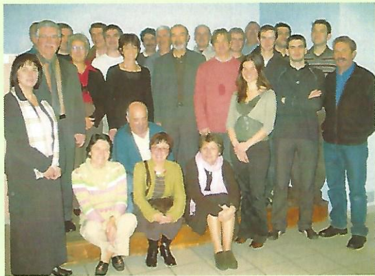
Le 4 janvier, les élus de Ousse et Artigueloutan ont eu le plaisir de recevoir toute l'équipe de techniciens de la CDA qui a travaillé sur nos PLU : une manière simple et conviviale de marquer notre satisfaction et notre reconnaissance à ce service communautaire qui a nous a accompagné durant plus de deux ans sur ces projets.