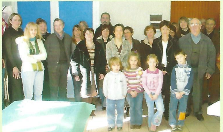
la réception des nouveaux habitants le 27 janvier