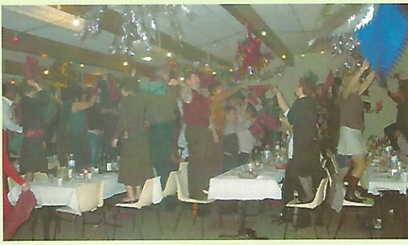
le réveillon organisé par le club de football