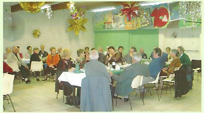
le repas des aînés et du personnel communal le 21 janvier 2007