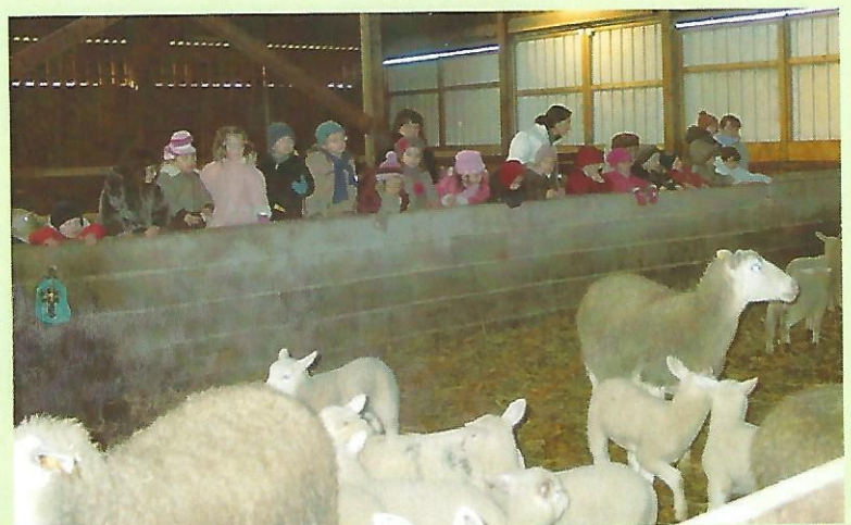
l'école en visite à la bergerie : une sortie appréciée des enfants et bien dans l'esprit de notre travail accompli durant l'élaboration du PLU .