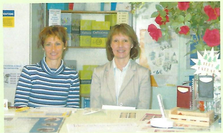
L'agence postale communale à votre service du lundi au vendredi de 8h30 à 11h30.