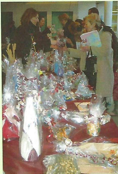
le marché de Noël à l'école le 22 décembre

Dernière réunion publique de conclusion de notre Plan Local d'Urbanisme le 16 novembre : à l'image des réunions précédentes, une très importante participation des habitants a marqué ce rendez vous . Nous avons eu le plaisir de présenter notre travail de réflexion mené avec les agriculteurs : « Faisons terre ensemble » .