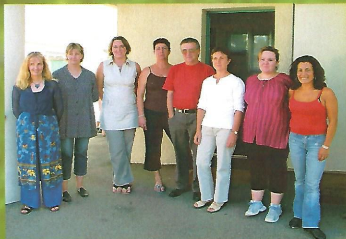
Rentrée scolaire 2006, les enseignants et les employées municipales.