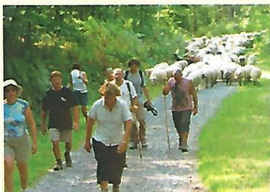
La transhumance, le samedi 9 septembre.

Des épreuves ludiques proposées par la Prévention routière à l'intention des enfants et des adultes ont permis aux nombreux participants de tester leurs connaissances.