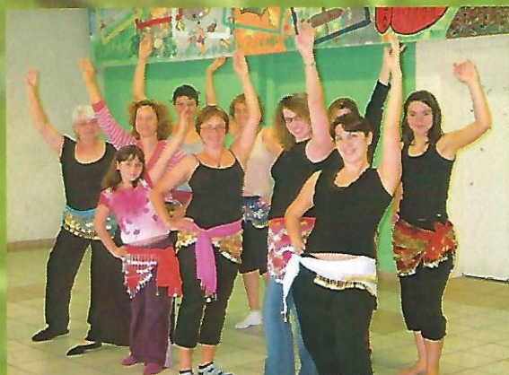
Danse au foyer rural d'Artigueloutan