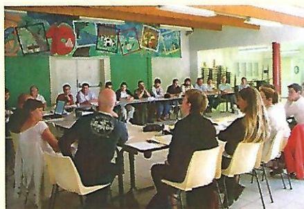
Réunion de la chambre d'agriculture le 28 septembre