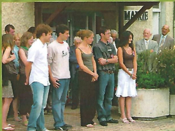
Les conscrits lors de la fête locale le 18 juin 2006.