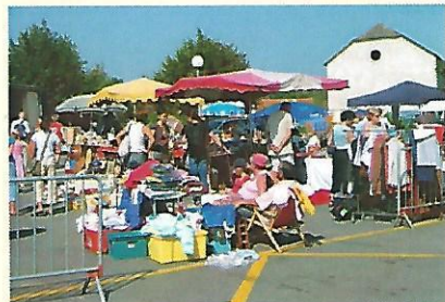
Le vide grenier du Foyer rural le dimanche 3 septembre

Le tournoi de foot du Football Club de la vallée de l'Ousse : malgré les travaux non achevés au abords du stade, le tournoi des poussins et benjamins a pu avoir lieu dans des conditions acceptables. Plus de 240 enfants et leurs parents ont passé la journée à Artigueloutan dans une excellente ambiance et, grâce à un beau soleil au tournoi des bénévoles du club, le tournoi 2006 a été un succès.